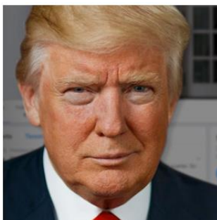
Sourire de domination

Par exemple, si une institutrice gronde un enfant asiatique qui vient de faire une bêtise, il est probable que celui-ci lui sourira dans le but d'implorer son indulgence... ce qui aura comme conséquence d'énerver encore plus son institutrice qui pensera qu'il se moque d'elle !